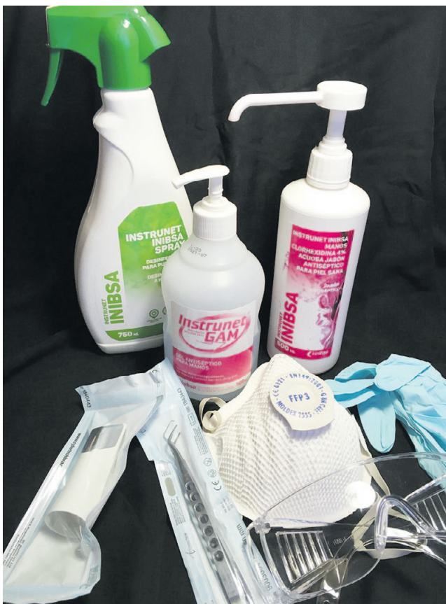
Alguns dels productes usats per a neteja, desinfecció i protecció per evitar infeccions creuades