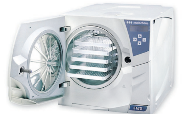
Autoclau tipus B per esterilitzar instruments dentals | ocd

“ La majoria de consultes disposen dels mitjans necessaris per eliminar els microorganismes patògens i garantir la seguretat dels pacients”